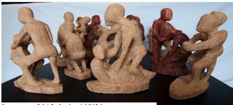
Lutteurs, 2012, bois, 10X20 cm