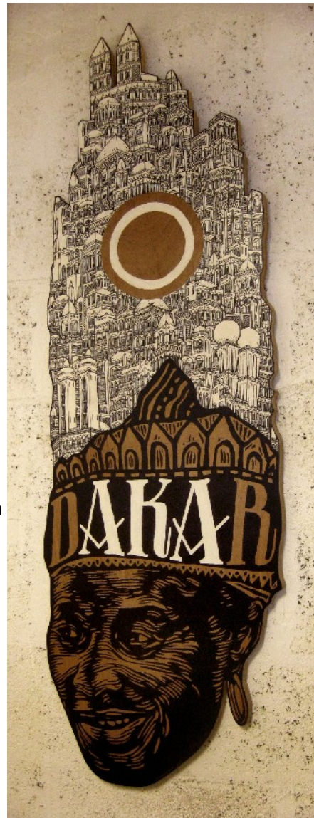
Densité DK, 2011, encre et la peinture sur bois. 150X 50 cm

Jiem peintre muraliste mais aussi graveur, a commencé la saison artistique du TDM par sa résidence « Cheptel vif ». Pour l'exposition Voix off, Il s'inspire de l'art publicitaire africain en réalisant in situ différentes devantures de commerces. Initialement de fortune la représentation publicitaire peinte à la main fait partie intégrante de l'identité culturelle de ce continent et de son paysage urbain.