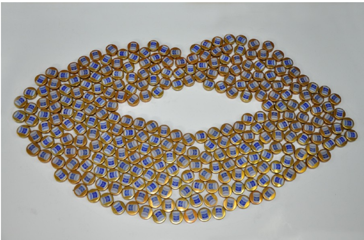
Sourire Mentholé, 2012, collage, 50X80 x1cm