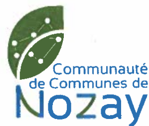
Région de Nozay