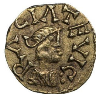
Tiers de sou d'or mérovingien frappé à Rezé vers 620, découvert à Rezé

À côté du roi, les grands seigneurs s'autorisent progressivement à frapper ces monnaies de forte valeur.