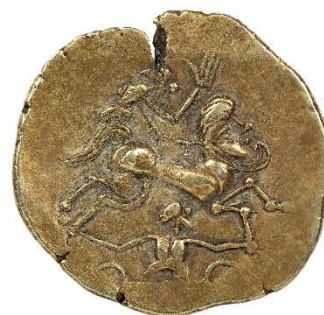
Statère d'or gaulois des Namnètes découvert à Nantes

À voir : les trésors de Pannecé II, de Haute-Goulaine, de La Chapelle-Launay, de Rezé, de Besné et de Nantes ainsi que des trouvailles isolées gauloises et gallo-romaines.