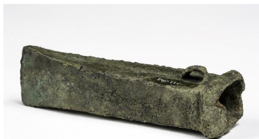
Hache à douille en bronze découverte à Treillières

Leur dispersion géographique donne l'impression qu'elles servaient de moyen de paiement lors d'échanges commerciaux. Leurs tailles variées permettent d'y voir l'existence de valeurs différentes. La variété de leurs motifs géométriques (lignes, points, cercles) fait penser à des marques identitaires de groupes humains. D'après ces éléments, sept