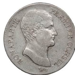
Pièce de 5 francs de Bonaparte, premier consul, découverte à Clisson

Le système est basé sur un rapport or/argent établi à 15,5 grammes d'argent pour 1 gramme d'or. Le « napoléon » est la pièce en or de 20 francs. Le franc est une pièce d'argent de 5 grammes et le centime est une piécette de cuivre d'1 gramme. À partir de 1865, cette organisation monétaire est étendue à la Belgique, la Suisse et l'Italie, puis l'Espagne et la Grèce en 1868, puis d'autres pays encore... Les frontières monétaires tombent, c'est « l'Union latine » qui perdure jusqu'en 1927.